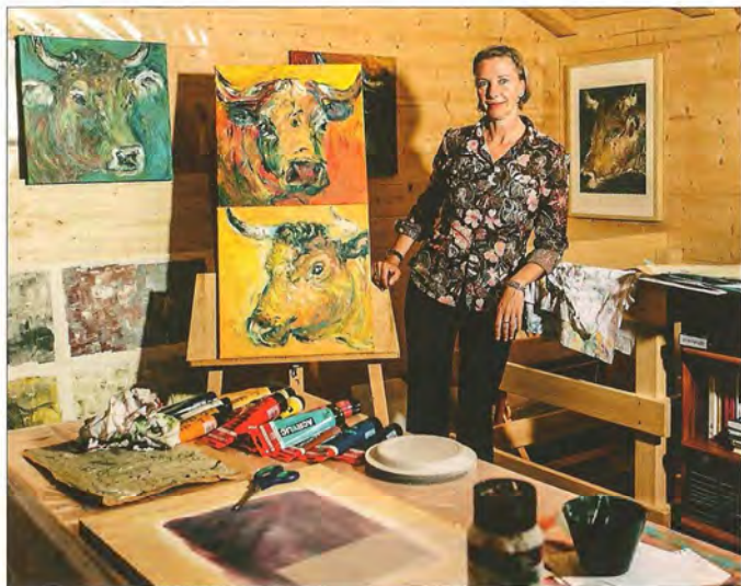
In Bellwald sind zahlreiche neue Malereien und Zeichnungen entstanden.

kuhkämpfe. «Ich finde es sehr schön, dass dieses Kulturgut erhalten wird und wie stolz die Walliser darauf sind.» Nur noch wenige Tage wird die Künstlerin in Bellwald sein. Mitnehmen wird sie nicht nur neue Bilder und Erinnerungen, sondern auch das Gefühl, hier noch etwas fortsetzen zu können. Deshalb hat sie sich vorgenommen, im nächsten Jahr wieder nach Bellwald zu kommen, um ihr Werk weiterzuführen.