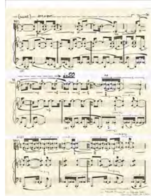
2023: „Ohrensessel“ für Violine und Cembalo