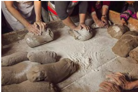
2023: „Roggenbrot backen in Bellwald“