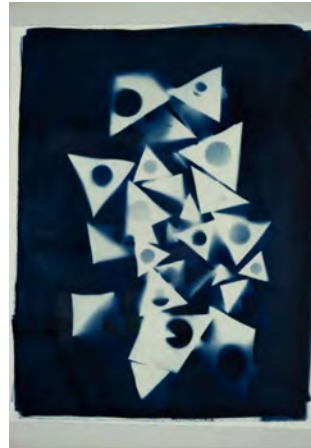
2023: „Die Sonne von Bellwald“