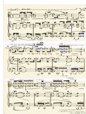
2023: „Ohrensessel“ für Violine und Cembalo