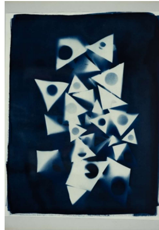
2023: „Die Sonne von Bellwald“