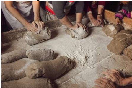
2023: „Roggenbrot backen in Bellwald“