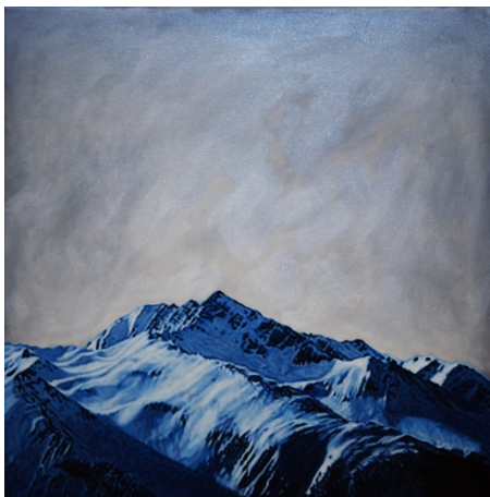
Berg im Wallis 2018; Oel und Acryl auf Leinwand, 60 x 60cm