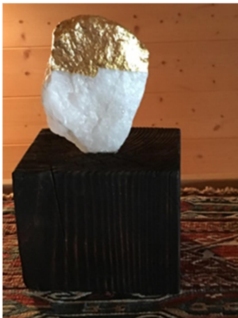
„Weisser Quarz“ 2018; in Steinhaus/VS gefunden