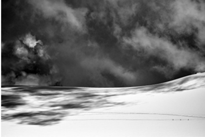
„Gletscher in Zermatt“ 2018; Foto auf Aluminium, 60 x 40cm